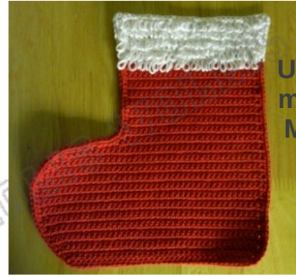
Umhäkelt mit festen Maschen

Die Socke mit Häkelnadel Nr. 3 in rot häkeln.