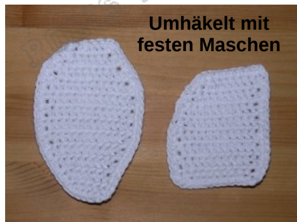
Umhäkelt mit festen Maschen

Die Spitze und die Hacke mit Häkelnadel Nr. 3 in weiß häkeln.